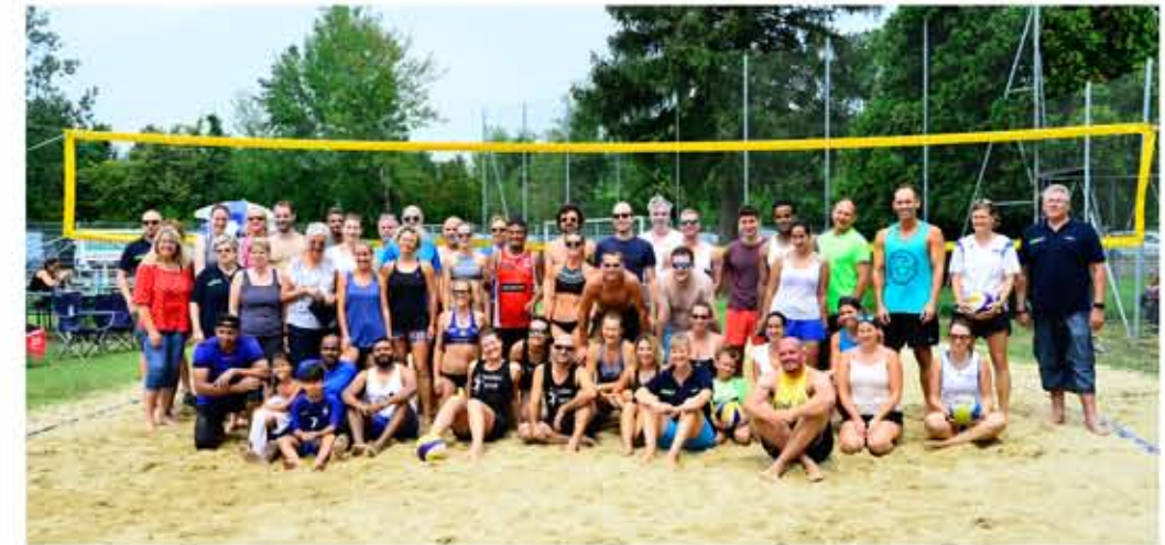
Die Organisatoren von impulsE - Dorferneuerung und die teilnehmenden Volleyballteams